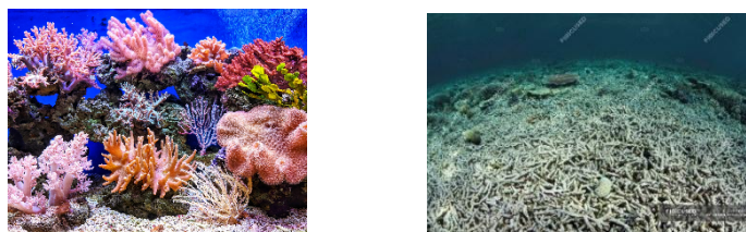
Figura 1A: Recifes íntegros. Figura 1B: Recifes destruídos.