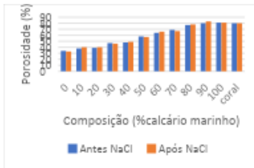
Figura 4: Porosidade dos CPs (%).