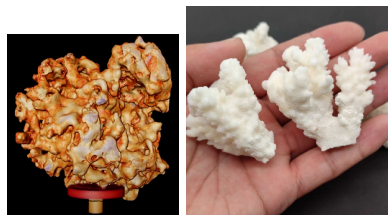
Figura 7: Análise tomográfica do coral verdadeiro. Figura 8: Coral gerado em impressora 3D.

Na Figura 7 encontra-se a avaliação tomográfica de um coral verdadeiro que serviu de base para geração dos melhores parâmetros de impressão 3D com tamanho de camada de 1 mm, 5% de preenchimento retilíneo e extrusão de 1 mm, utilizando 60%, em massa de calcário marinho e 40% de argila, como pode ser observado na Figura 8.