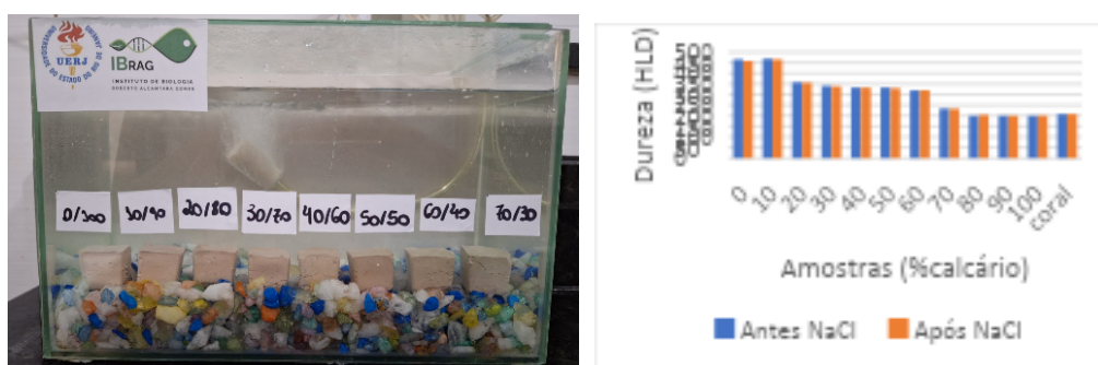
Figura 2: Ensaio em aquários UERJ (água salgada 35% p/v). Figura 3: Dureza (HLD).

A Figura 3 apresenta os resultados da dureza das amostras em função do percentual de calcário marinho, antes e após submissão a ambiente salino. Verifica-se que a dureza do corpo de prova sem calcário marinho é de 466 HLD (material rico em SiO 2 ) e à medida que se adicionam percentuais de calcário a dureza se reduz gradativamente, chegando-se a em torno de 200 HLD com 100% de calcário marinho. Porém, comprando-se com um coral marinho que apresenta dureza de 210 HLD, todos os corpos de prova encontram-se adequados para utilização. Isso ocorre, pois na composição do calcário marinho não há apenas calcita, mas também quartzo, como observado na difração de raios-X, o que permite a geração de um coral artificial mais resistente que o coral real. Além disso, há que se observar que as condições salinas não afetaram a dureza dos compósitos.